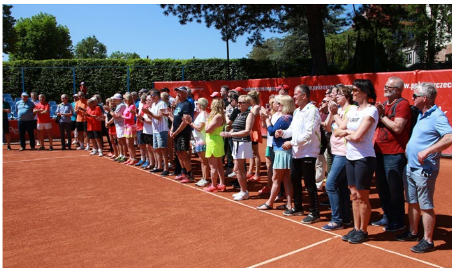
Zawodnicy – zgłoszonych 110 os., grających 104. Piłki tenisowe – Tretorn Control Plus Series