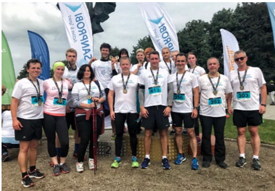
Zespół Kliniki Urologii i Onkologii Urologicznej