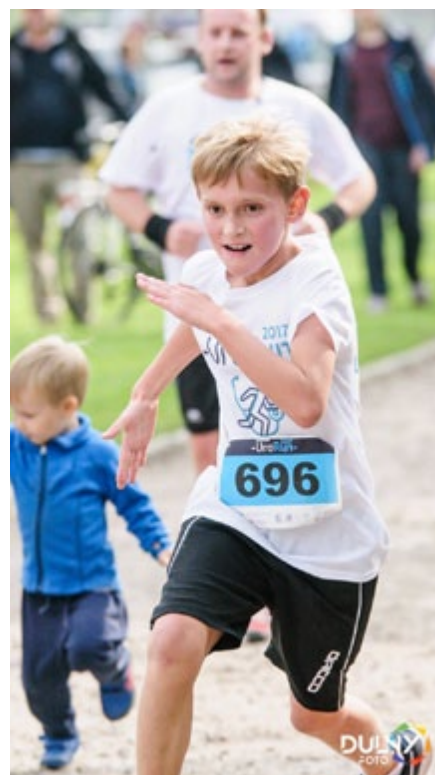
Najmłodszy uczestnik biegu na 10 km

Patronami honorowym wydarzenia byli m.in. JM Rektor Pomorskiego Uniwersytetu Medycznego, Prezydent Miasta Szczecina oraz Europejskie Towarzystwo Urologiczne. Organizatorzy w szczególności sposób dziękują Marszałkowi Województwa Zachodniopomorskiego, Wojewodzie Zachodniopomorskiemu, Okręgowej Radzie Lekarskiej i Prezesowi Polskiego Towarzystwa Urologicznego za wsparcie finansowe, pomoc organizacyjną i udzielone patronaty.