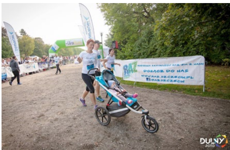
Na biegu panowała prawdziwie rodzinna atmosfera