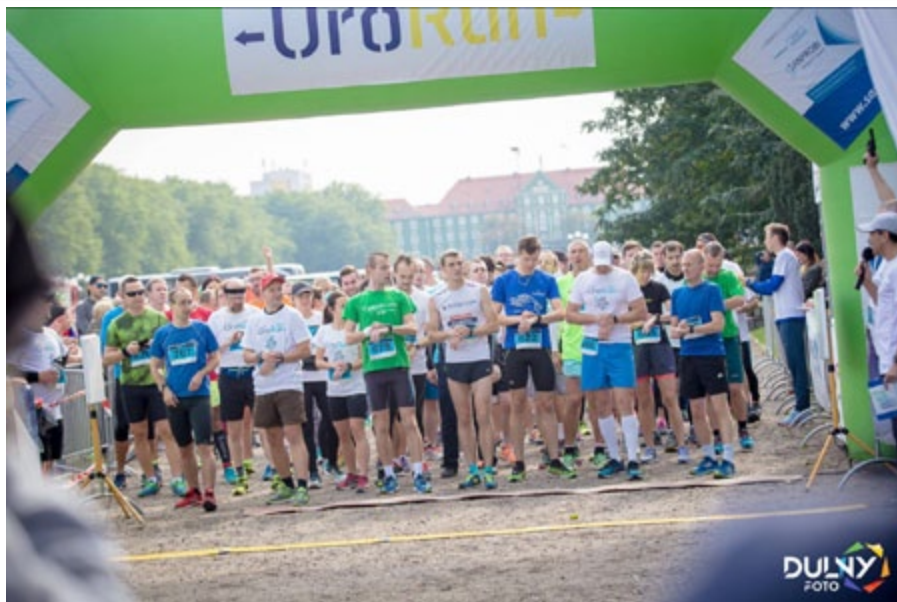
Biegacze na koronnym dystansie 10 km szykują się do startu