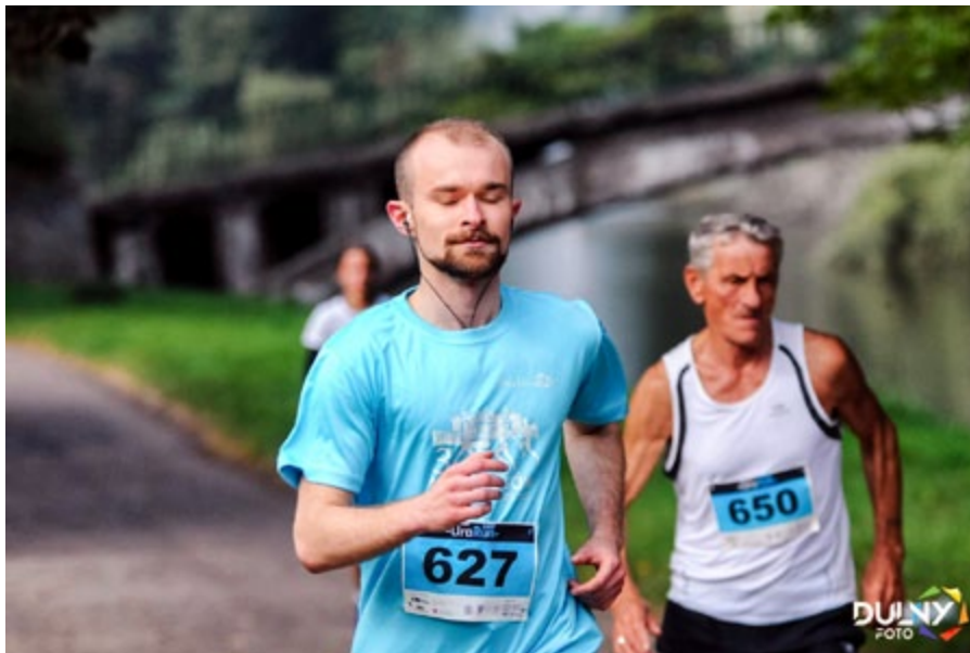
Ruch łączy pokolenia

„Europejski Tydzień Urologii” w wydaniu szczecińskim rozpoczął się silnym akcentem. W tym czasie byliśmy widocznymi w wielu mediach, niosąc przesłanie aktywnego i zdrowego stylu życia. Daliśmy również osobisty przykład poprzez masowy