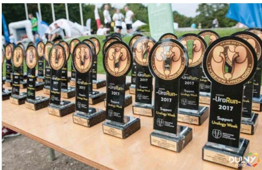
Puchary czekają na zwycięzców