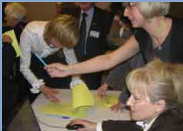
Nieocenione Biuro OIL przy pracy podczas Zjazdu