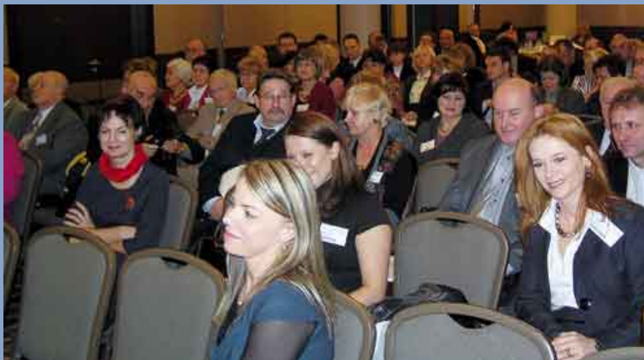
Jesteśmy w komplecie , można zaczynać...