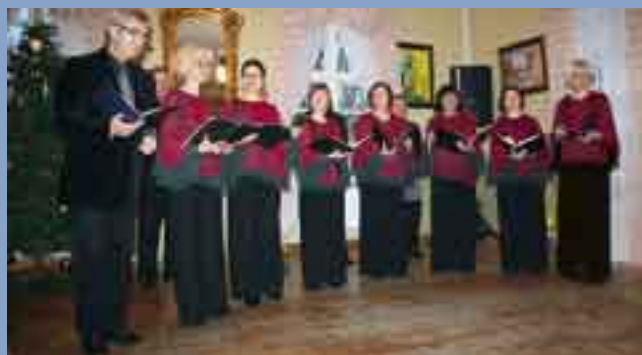
Występ Chóru podczas grudniowych obrad ORL VI kadencji