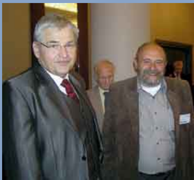
...jedynie my, recydywiści, trzymamy ciągle stary kurs...