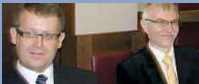
Część OKW V kadencji