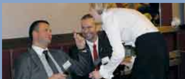
U rzeczników jak zwykle sympatycznie