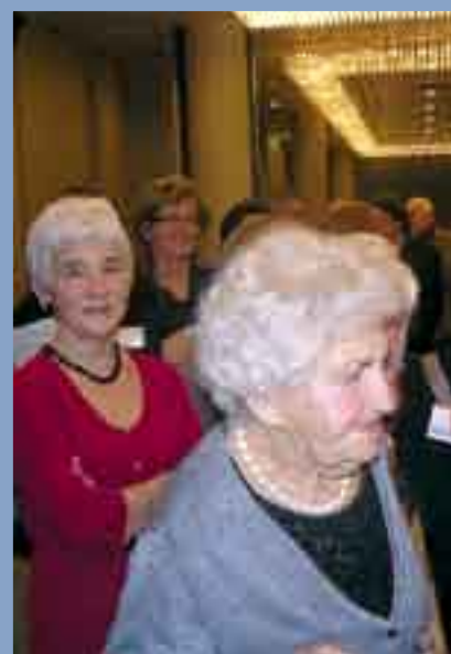
W tej kolejce nikt nie narzekał...