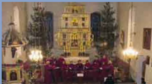
Koncert w kościele w Zielinie a w tle przepięknie odrestaurowany ołtarz z 1614 roku